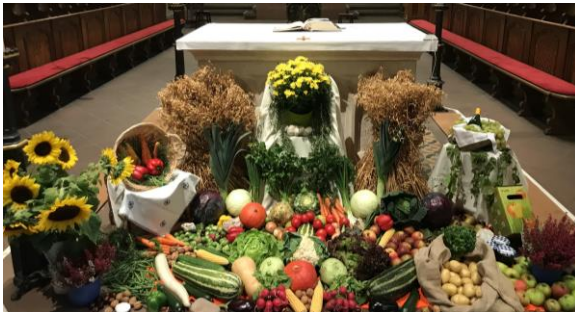
Erntealtar in der Basilika St. Wendelin