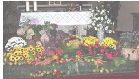
Erntealtar in der Pfarrkirche in Winterbach

Um die Reise detailliert planen und auch ausschreiben zu können, wäre es im Vorfeld wichtig zu wissen, wer an dieser Reise beabsichtigtes Interesse hat. Wir erbitten hierzu eine Voranmeldung bis 25. November 2013 im Zentralbüro in St. Wendel. Ab 30 Personen kann die Pilgerfahrt stattfinden!