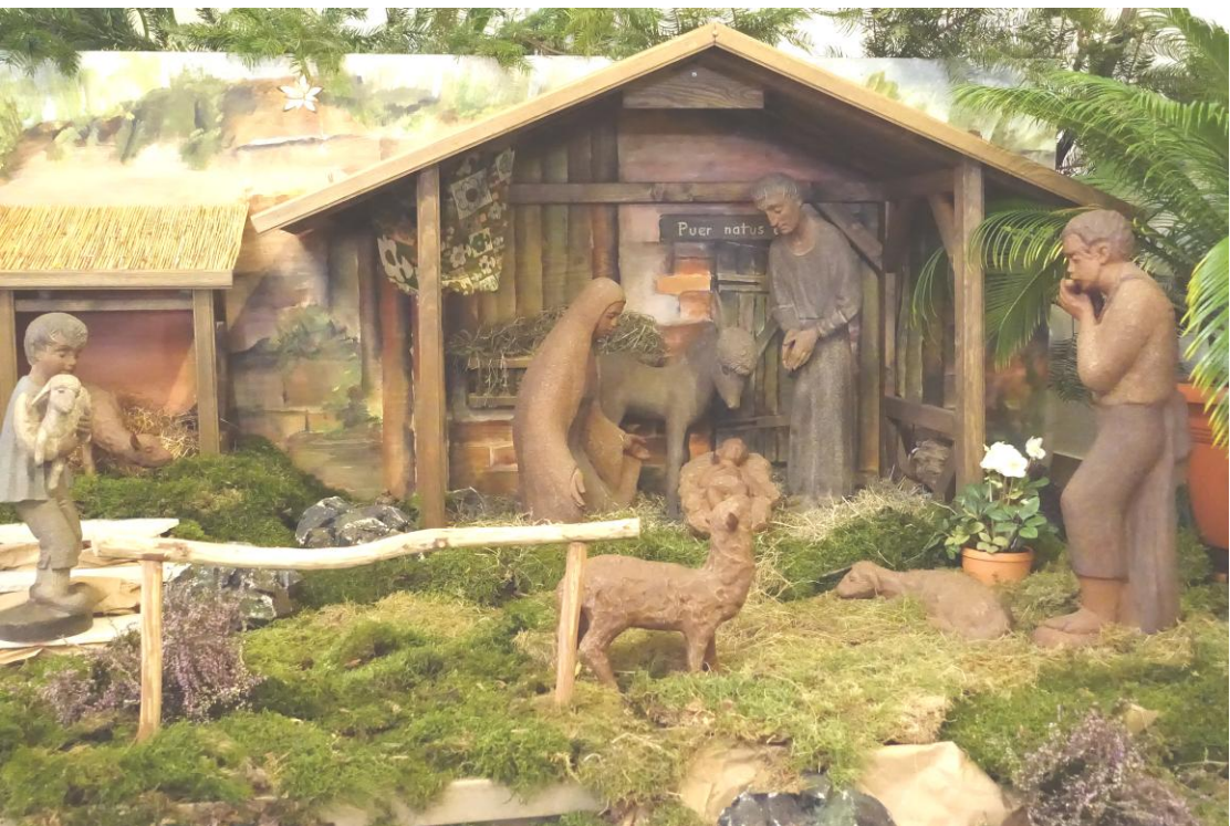
Krippe in der Pfarrkirche St. Anna in Alsfassen

Nr. 17 (7. Jg.) 18. – 31. Dezember 2017 0,50 €uro