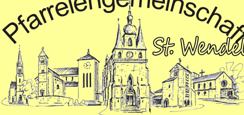
Winterbach Bliesen St. Wendel St. Anna St. Wendel Basilika Urweiler Niederlinxweiler

Nr. 5 (8. Jg.) 26. März – 8. April 2018 0,50 €uro