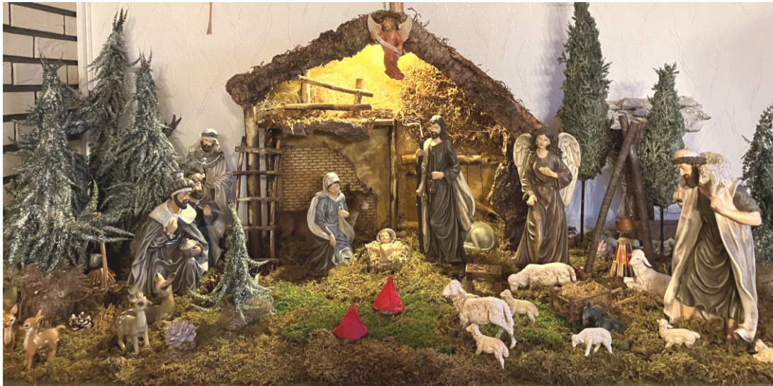
Weihnachtskrippe der Familie Kockler in Remmesweiler