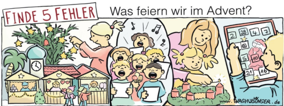
Palme, Tulpe, Eis, 5te Kerze, Türchen Nr. 28

Und vieles andere mehr. Ich fände es schön – und ich versuche es auch jedes Jahr –, wenn es auch ruhige Momente im Advent gibt. Damit ich mich auch innerlich ein bisschen auf Weihnachten vorbereiten kann, darauf, dass Jesus geboren ist. Darüber nachzudenken, was für ein großes Geschenk wir Menschen bekommen haben, dass Gott Mensch geworden ist. Dass er uns so sehr liebt. Das freut mich, und dann überlege ich mir, wie ich anderen eine Freude machen kann. Jetzt im Advent. Den Mitschülern, den Eltern oder Großeltern. Weihnachten ist ein Fest der Freude, und die Freude wird größer, wenn ich mit meinen kleinen Möglichkeiten Freude teile. Nicht erst am 25. Dezember, sondern jetzt schon im Advent. Versucht das doch auch einmal. Es macht Freude, Freude zu schenken. Und die Wartezeit auf Weihnachten wird auch kürzer.