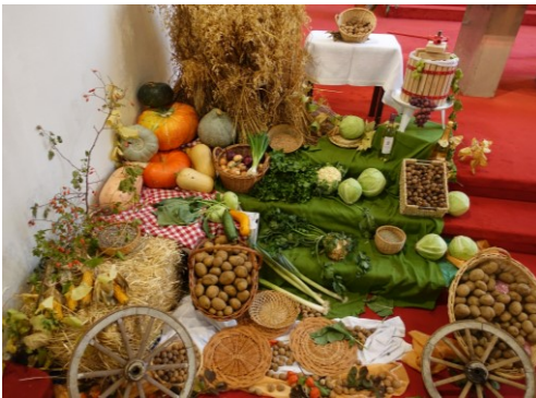
Erntealtar in der Pfarrkirche in St. Anna