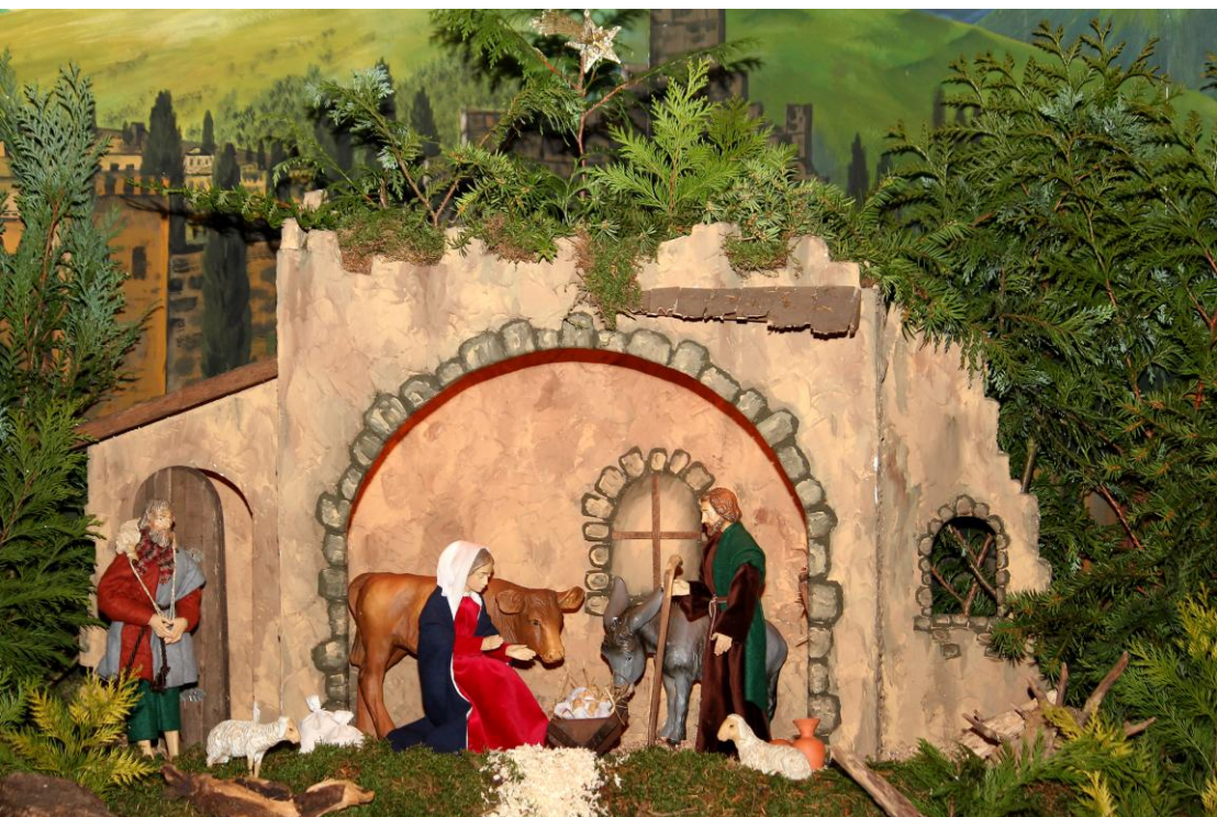
Krippe in der Pfarrkirche Heilige Familie in Winterbach