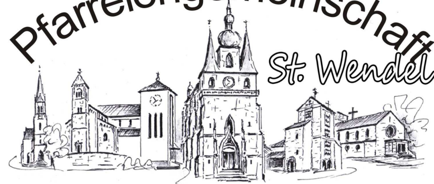
Winterbach Bliesen St. Wendel St. Anna St. Wendel Basilika Urweiler Niederlinxweiler

Nr. 4 (4. Jg.) 3. – 23. März 2014 0,50 €uro