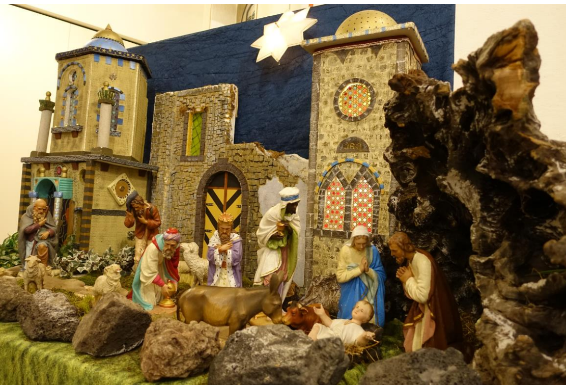
Krippe in der Pfarrkirche St. Marien in Urweiler

Nr. 17 (8. Jg.) 10. – 31. Dezember 2018 0,50 €uro