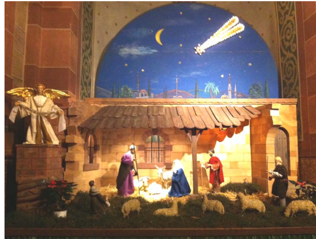
Krippe in der Pfarrkirche St. Remigius in Bliesen

Nr. 17 (4. Jg.) 15. – 31. Dezember 2014 0,50 €